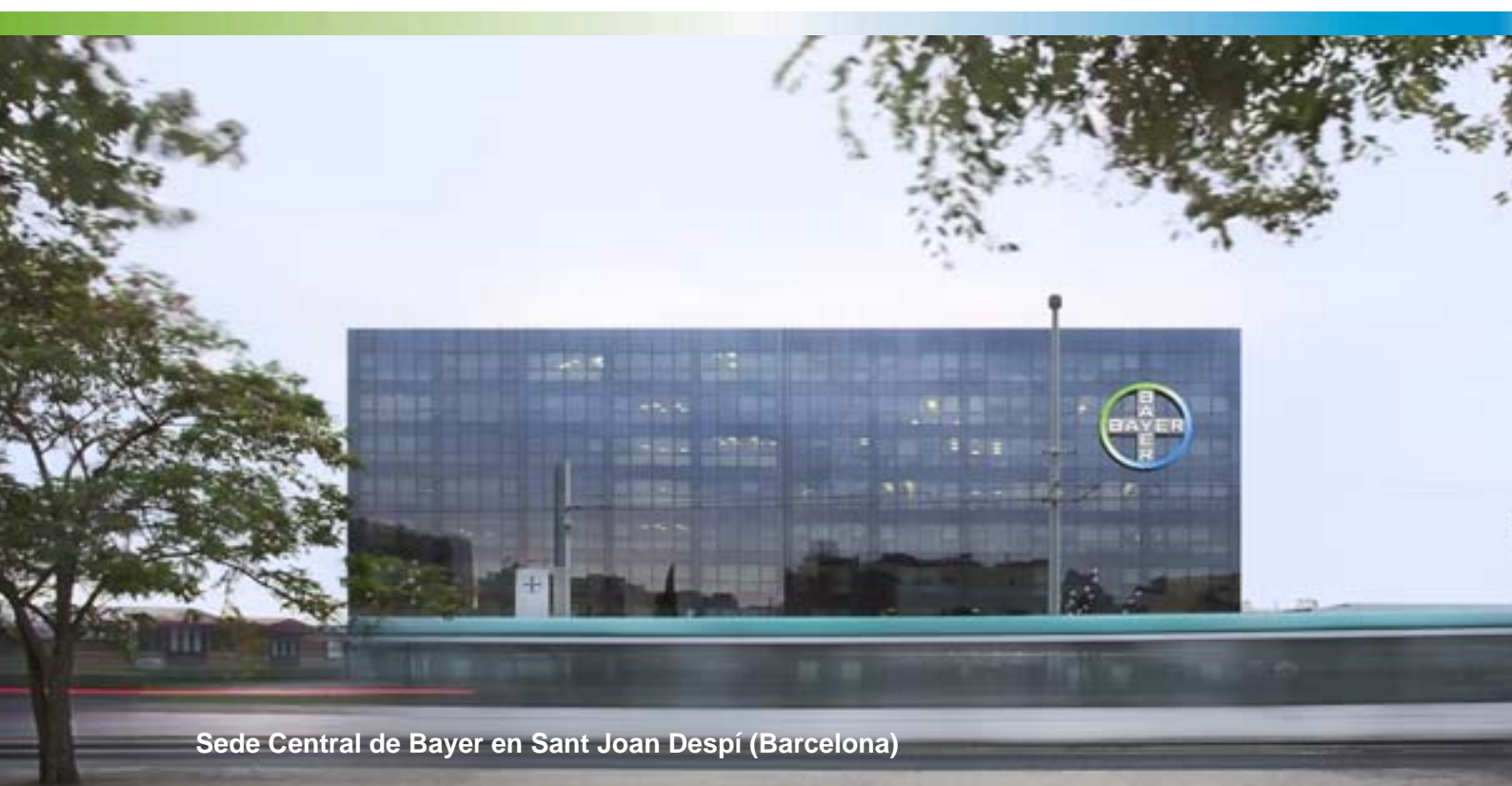
Sede Central de Bayer en Sant Joan Despí (Barcelona)