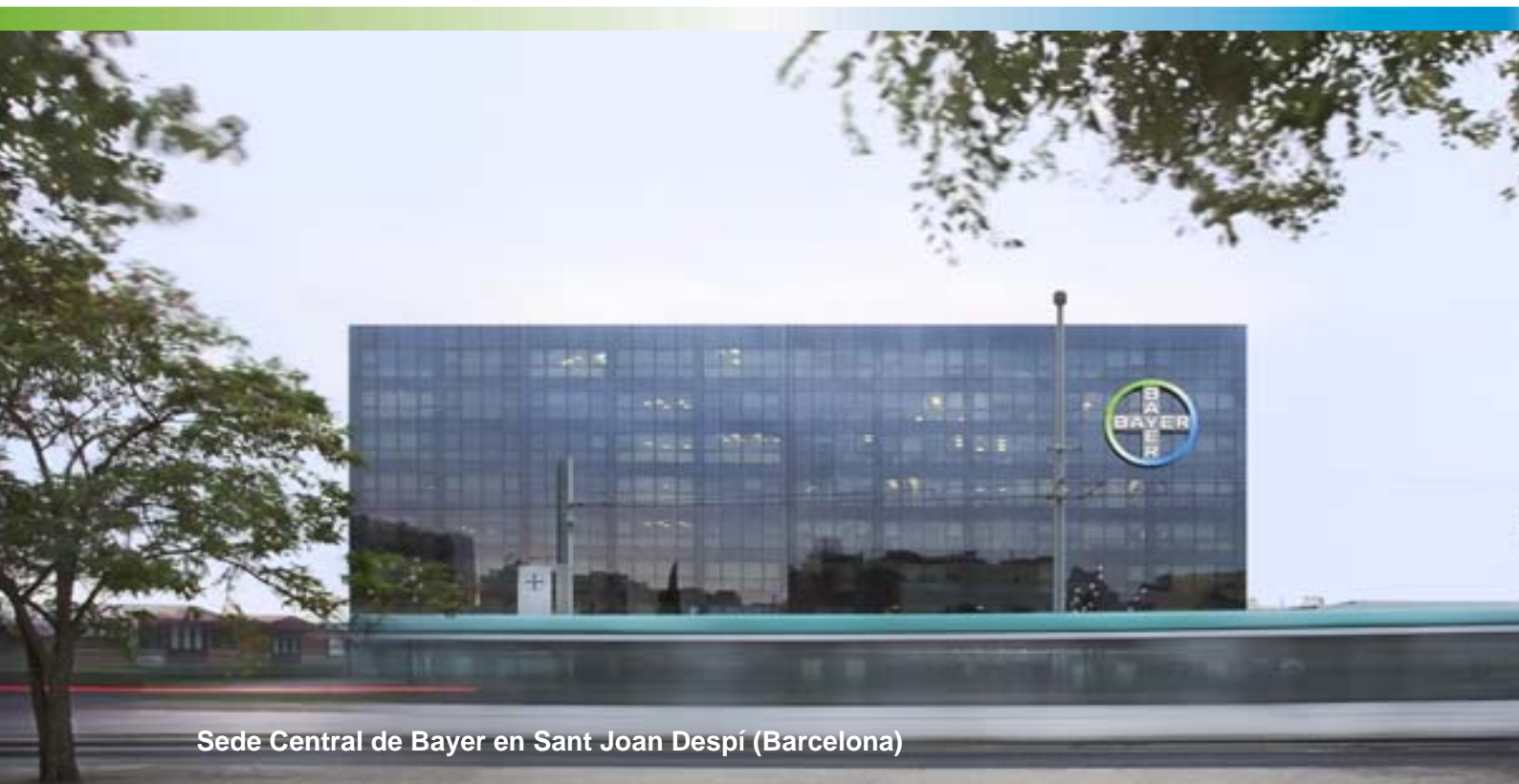
Sede Central de Bayer en Sant Joan Despí (Barcelona)